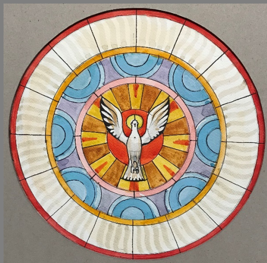
A „Szentlélek ábrázolása galamb formájában” a kiáradó fénysugarakkal

A következő fejezetben megismerheti az ólomüveg ablakok tervét.