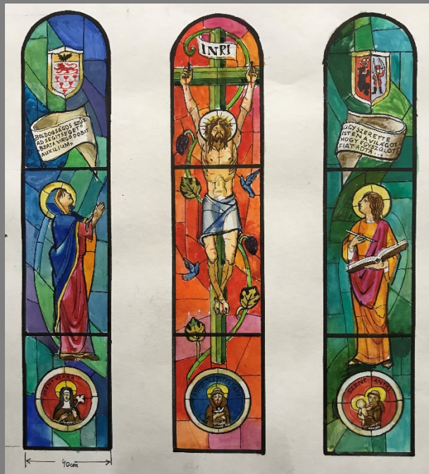
Az oltár fölött a Golgota